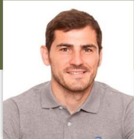
IKER CASILLAS FERNÁNDEZ